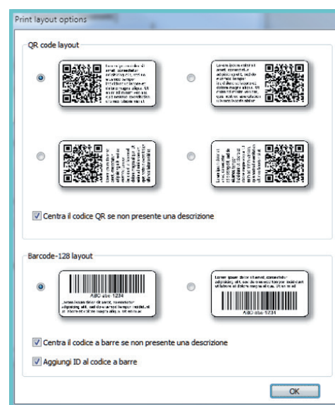
Pannello di configurazione del layout di stampa delle etichette